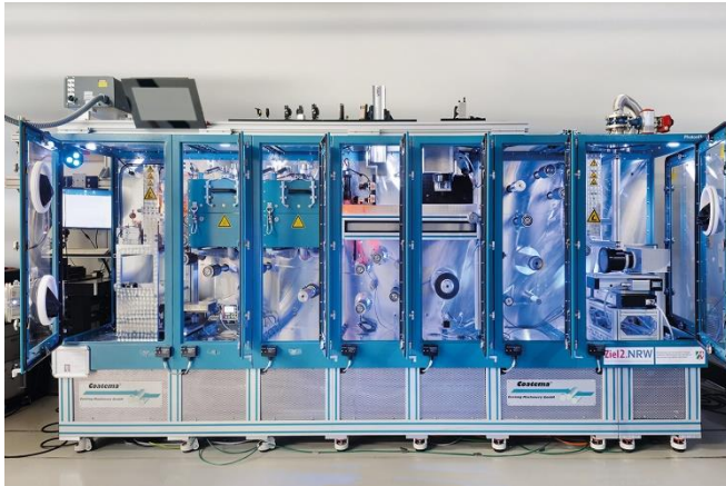
Bild 1: In EffiLayers wird die im Vorgänger-Projekt PhotonFlex entwickelte laserbasierte Rolle-zu-Rolle-Produktion von organischer Photovoltaik weiterentwickelt und so die Wettbewerbsfähigkeit von Maschinenbauern aus NRW erhöht.

FRAUNHOFER-INSTITUT FÜR LASERTECHNIK ILT