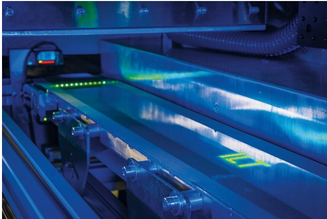
Bild 3: Ein diffiziler Prozess: Das Abtragen von nanometerdünnen Schichten auf einem bewegten Folienband mit dem UKP-Laser-Scribing im fs-Regime.